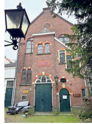
De voorgevel van het kerkje op de binnenplaats achter de Oude Delft.

„Daar komt de keuken, daar komt een bar en daar de wc's”, gebaart Pels Rijcken in de consistoriekamer naast de kerkruimte.