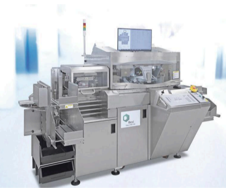
De toeleverancier aan de chipsector Besi zakte 7,5 procent. Beleggers rekenden na het bereiken van een recordkoers op woensdag op een positieve prognose.