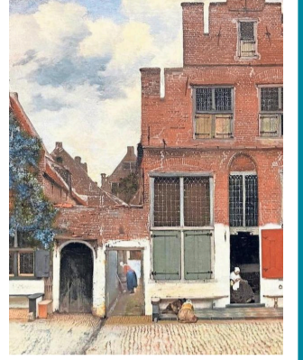
Het Straatje van Vermeer in het Rijksmuseum. De oude mouterij staat rechts achterin de steeg.

Dat zijn overigens niet zomaar wanden. De steeg is volgens de Britse historicus Andrew Graham-Dixon namelijk de doorgang die Johannes Vermeer rond 1658 schilderde achter de twee poortjes op zijn beroemde Straatje van Vermeer . Eén van de tuit-